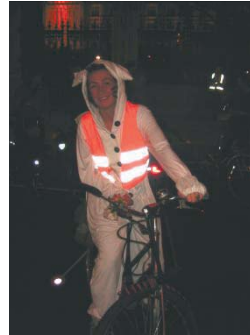
Critical Mass-fietstocht, Londen 2005.

In reactie op het incident op 30 september kondigden de fietsers de 'grootste Critical Mass-fietstocht in Londen ooit' aan voor de vrijdag voor Halloween. In de aankondiging staat te lezen: "De Critical Mass in Londen draait al sinds 1994 zonder dat de politie met arrestaties heeft gedreigd om ons de wet te kunnen voorschrijven. Waarom doen ze dat nu dan wel terwijl het tot nu toe niet nodig was? Waarom ver-